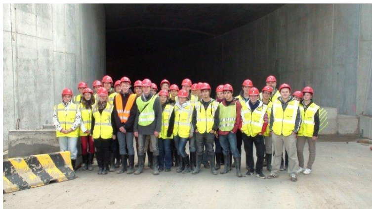
Obrázek 1. Studenti SPŠ J.Gočára na staveništi tunelu Blanka