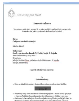
Obrázek 2. Titulní list darovací smlouvy.